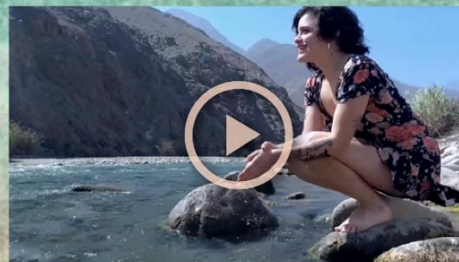
Videoclip - Agua de Manantial