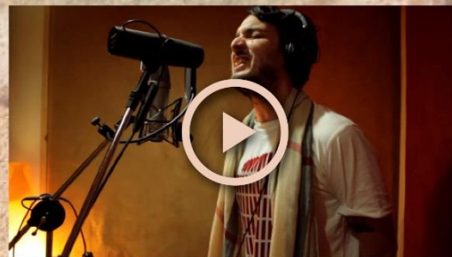
Videoclip - Quiero Que Llueva