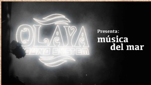
Olaya Sound System presenta “Música del Mar”