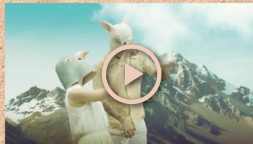
Videoclip - Desaparecer